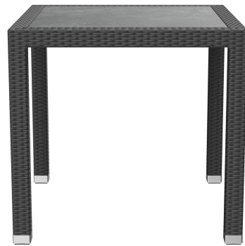
TABLE À MANGER OTIS