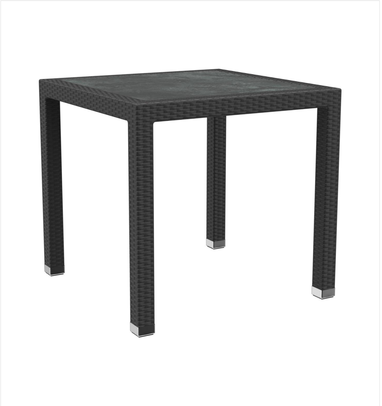
TABLE À MANGER OTIS