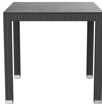
TABLE À MANGER OTIS