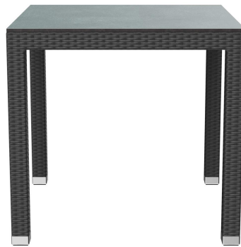
TABLE À MANGER OTIS