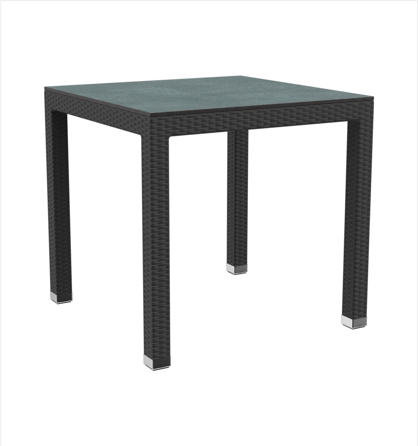
TABLE À MANGER OTIS