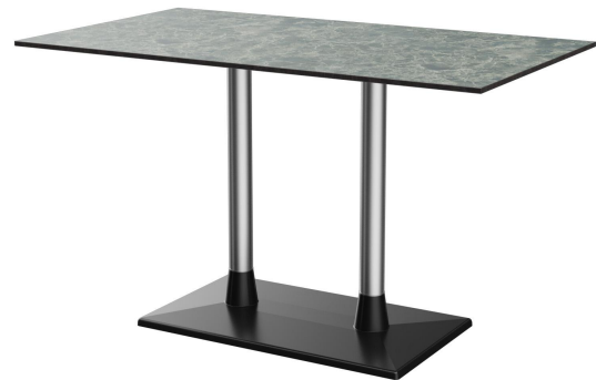
TABLE À MANGER MODULAR T