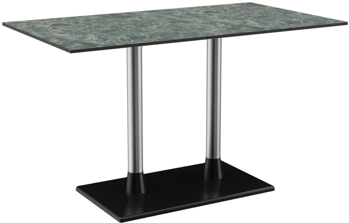
TABLE À MANGER MODULAR T