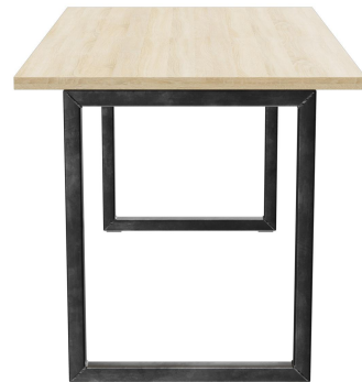
TABLE À MANGER RICKON