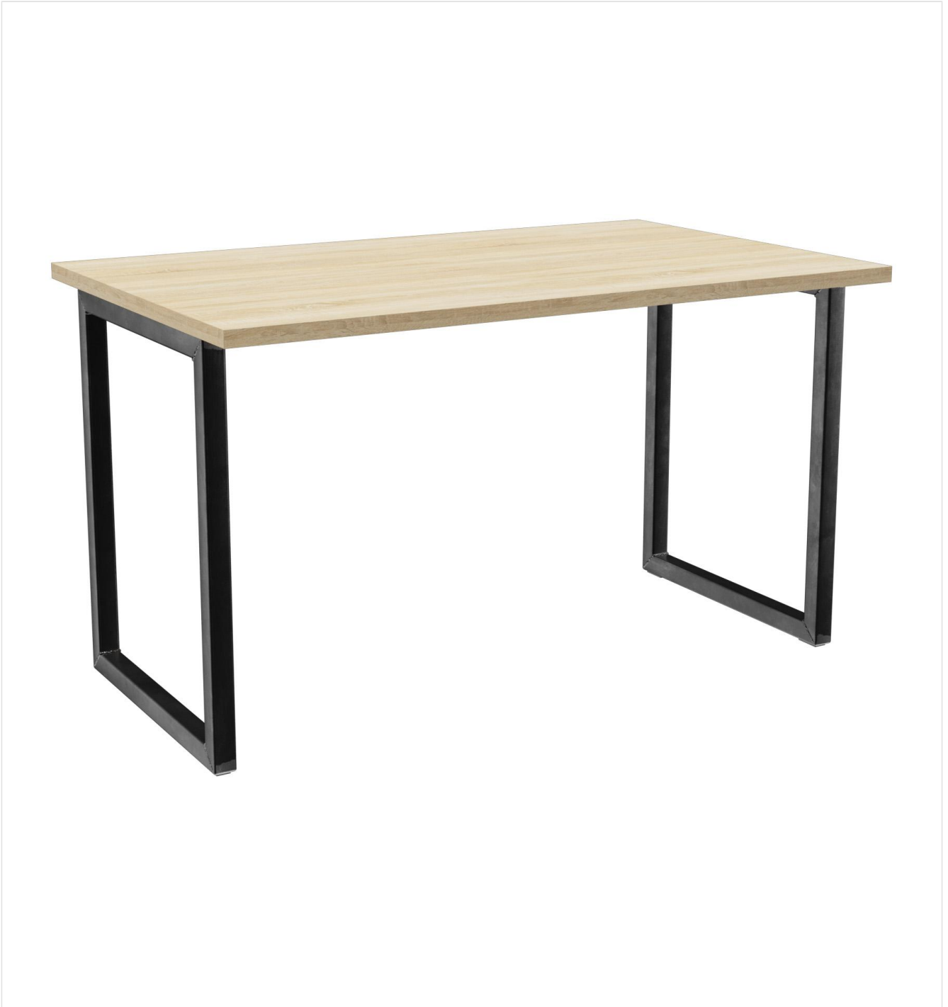
TABLE À MANGER RICKON